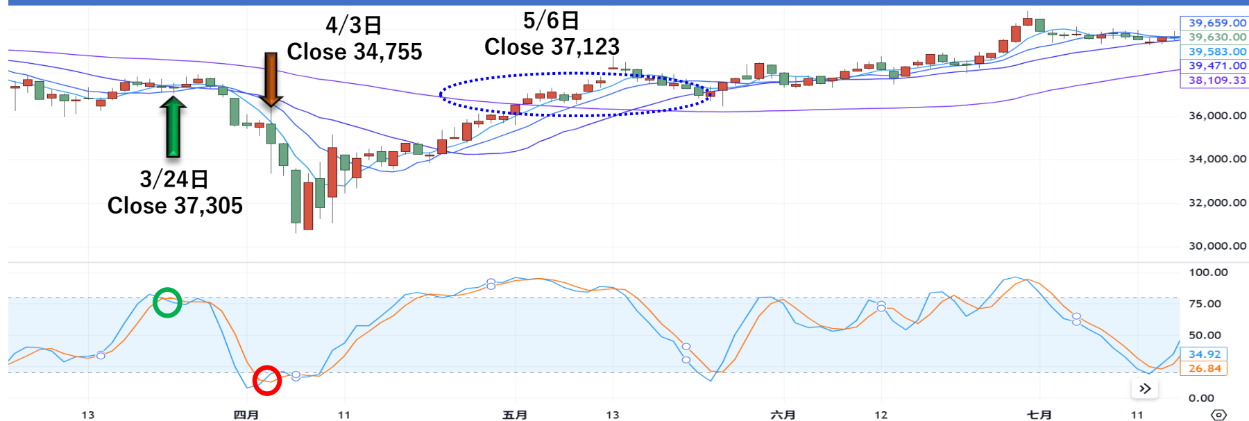
小日經期貨走勢與RSI指標